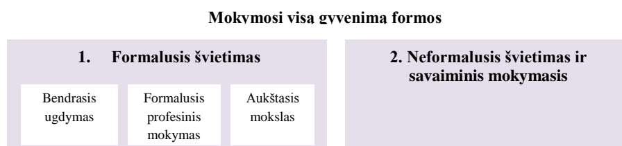
1 pav. Mokymosi visą gyvenimą formos