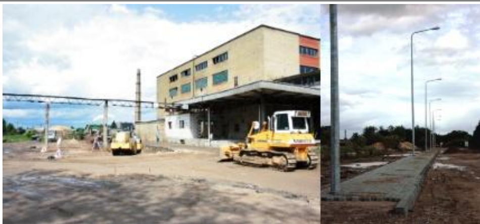
2 pav. Alytaus m. vykdomas projektas VP3-1.1-VRM-01-R-11-001

zonose, stiprinant verslo aplinką, keliant konkurencingumo lygį ir didinant eksporto potencialą per pramoninių zonų infrastruktūros modernizavimą.