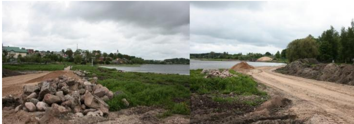
3 pav. Telšių rajono savivaldybės įgyvendinamas projektas VP3-1.1-VRM-01-R-81-009

Siekiant didinti miesto patrauklumą tiek gyventojams, tiek potencialiems investuotojams, mažinti atotrūkį nuo kitų šalies miestų, tikslinga kompleksškai sutvarkyti Masčio ežero pakrantę: įrengti pėsčiųjų ir dviračių takų sistemą, įrengti rekreacinę ir sporto infrastruktūrą šeimoms su vaikais, pavieniams miestiečiams, jaunimui (vaikų žaidimų aikštelės, suoliukus, paplūdimį, pavėsinę ir vasaros estradą, valčių prieplauką ir kt.), šią infrastruktūrą pritaikyti žmonėms su negalia. Sukūrus tokį traukos centrą, atsirastų sąlygos plėtoti smulkųjį ir vidutinį verslą – jis galėtų pradėti teikti aktualias paslaugas didesniai lankytojų srautui: dviračių nuoma, viešasis maitinimas, pramogų organizavimas ir pan. Tokiu būdu būtų skatinamas gyventojų verslumas, pritraukiamos privačios investicijos. Tokiu būdu iš projekto naudos gaus ne tik Telšių miesto ir rajono gyventojai, bet ir apskrities gyventojai, miesto svečiai bei investuotojai.“