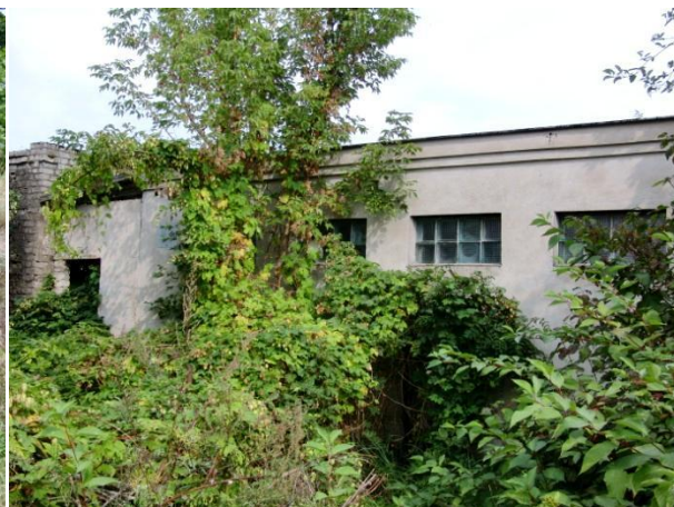
Lauko tualetas (266aH1p), A. Juozapavičiaus pr. 15F, Kaunas. Žemės sklypo plano rengimo darbai nepradėti.