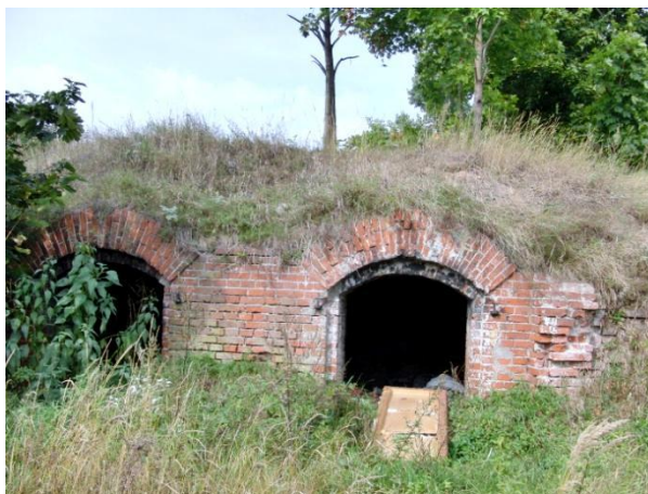
Kiemo rūsys (87F1p), A. Juozapavičiaus pr. 21E, Kaunas. Objektui rengiamas detalusis planas. Šis objektas yra teritorijoje, kuri įtraukta į kultūros vertybių registrą.