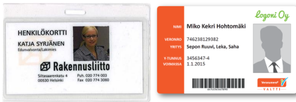
pav. 4 Suomiškų statybininko ID kortelių pavyzdžiai

Šis rangovo atsakomybės teisės aktas tapo ypač reikalingas, kai statybų sektoriui vis labiau internacionalizuojantis, sub-rangai buvo samdomos bendrovės iš įvairių šalių, kuriose darbo įstatymai bei apmokestinimas ženkliai skiriasi. Kortelių pagalba įvesta vienoda darbo tvarka ir apskaitos mechanizmas prisidėjo prie skaidrumo didinimo Suomijos statybų sektoriuje.