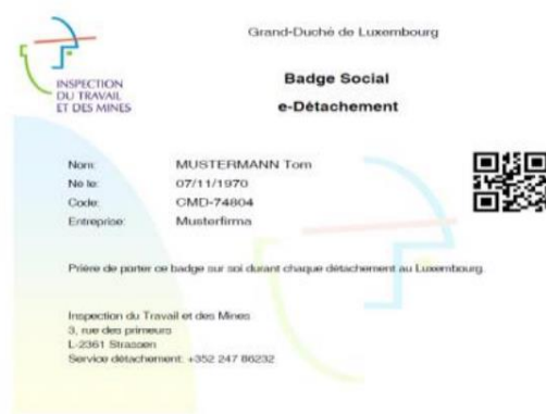
pav. 5 Liuksemburgo statybininko ID kortelės pavyzdys

2013 m. Liuksemburgo darbo inspekcija, po konsultacijų ir derinimų su socialiniais partneriais (darbdavių asociacijomis ir darbininkų profesinėmis sąjungomis) įvedė e-aplikaciją (e-Détachement) bei registraciją šioje sistemoje patvirtinančias korteles (Badge social). 27 Sistemoje 28 darbdaviai privalo registruoti visų sektorių darbuotojus, išskyrus tuos, kurie užsiima individualia veikla. Ant darbuotojo kortelės nurodoma darbuotojo vardas, darbovietė bei QR kodas, kurį nuskaičius darbo inspektoriai pasiekia visą reikalingą su darbuotoju susijusią informaciją, tokią kaip kilmės šalis, išsilavinimas, kvalifikacija, sveikatos pažymėjimas bei gyvenimo ir darbo leidimai. Be darbuotojo informacijos matoma ir kita su darbu susijusi informacija, tokia kaip darbo sutartis, įmonės rekvizitai ir registracija PVM mokėtoju. Už duomenų autentiškumą ir saugojimą, kortelių išdavimą ir inspektavimą atsakinga darbo inspekcija. Nustačius, kad privalomos tvarkos nesilaikoma, darbdavys pirmąsyk yra įspėjamas. Nesilaikant tvarkos pakartotinai gresia administracinė bauda nuo 25 Eur iki 25,000 Eur.