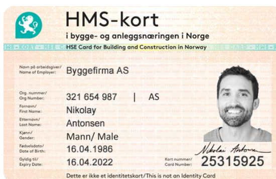
pav. 2 Norvegiškos statybininko ID kortelės pavyzdys

Norvegijoje ID kortelės pradėtos išduoti 2008 m. 17 Jos yra privalomos visiems asmenims dirbantiems statybų ir valymo paslaugų sektoriuose, tiek didelėse statybvietėse tiek privačiai. Paraiškas priima ir tikrina darbo inspekcija, 18 tačiau korteles gamina, išduoda ir administruoja privati įmonė 19 . Kortelės kaina 62 Eur + PVM.