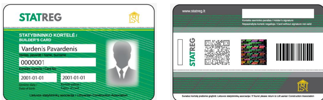
pav. 1 Statybininko kortelės pavyzdys

Statybininkų registras (STATREG) yra Lietuvos statybininkų asociacijos (LSA) įvesta nauja statybos sektoriaus darbuotojų savanoriško kompetencijų ir kvalifikacijų vertinimo sistema. Į šią sistemą užsiregistravusiam darbuotojui išduodama ID kortelė, patvirtinanti darbuotojo turimas kompetencijas. Užsakovai, būsimi darbdaviai ar statybų inspektoriai gali susipažinti su darbuotojų kvalifikacija 13 , kompetencijomis 14 , darbdaviu ir veiklos pobūdžiu nuskaitę kortelės QR kodą programėle išmaniajame telefone arba suvedę kortelės numerį ar asmens vardą STATREG tinklalapyje.